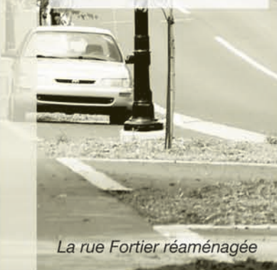
La rue Fortier réaménagée