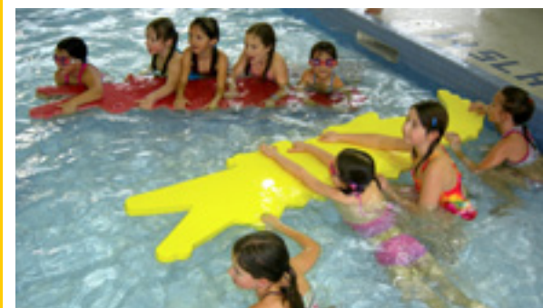
Inscription – Cours de natation : dès le 22 mars