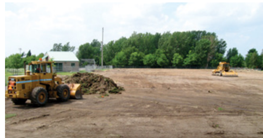
Le Parc multisports en construction l'été dernier.

Parmi les principales caractéristiques des terrains de soccer synthétiques, notons la permanence des équipements (lignes et filets) ainsi que le revêtement de fibres synthétiques, avec base de sable et granules de caoutchouc, qui assure, entre autres, une durabilité de la surface et qui permet de prolonger la saison... plus tôt au printemps jusqu'à tard à l'automne ! Pour connaître les modalités d'utilisation et de réservation, communiquez avec la réception du Service du loisir et du Centre aquatique en composant le 450 467-2854 poste 2257.