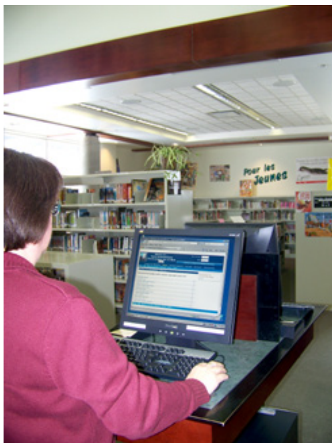
Des postes informatiques sont à la disposition des citoyens à la bibliothèque.

Visitez la section Cours de natation des Services en ligne en page d'accueil du site Internet de la Ville.