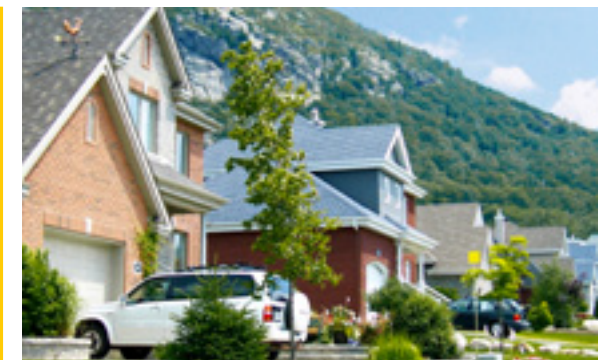
Radon : résultats de l'étude

Le parc MULTISPORTS : prêt pour la nouvelle saison !