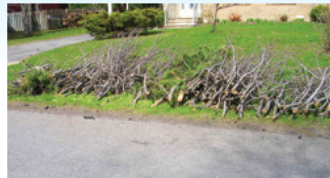
Bon exemple à suivre !