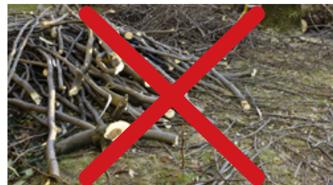
À ne pas faire ! Exemple de branches non ramassées

Pour visionner le parcours des deux équipes qui sillonneront le territoire simultanément, des extrémités de la ville vers le centre, au moment de la collecte d'avril, cliquez sur cette carte .