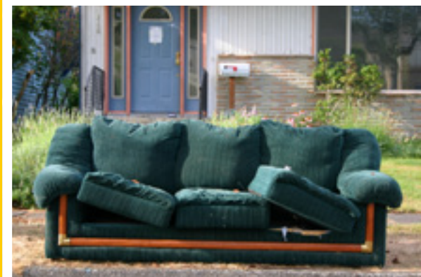
Collectes spéciales : 1 er au 7 mai