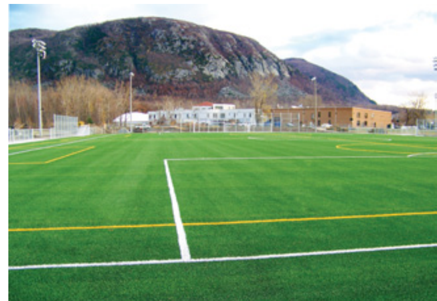
Les nouveaux terrains de soccer synthétiques du Parc multisports, 525, rue Jolliet.

Inscrivez-vous... c'est gratuit ! http://twitter.com/Ville_MSH