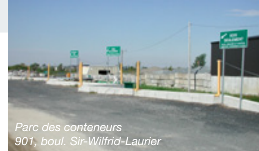
Parc des conteneurs 901, boul. Sir-Wilfrid-Laurier